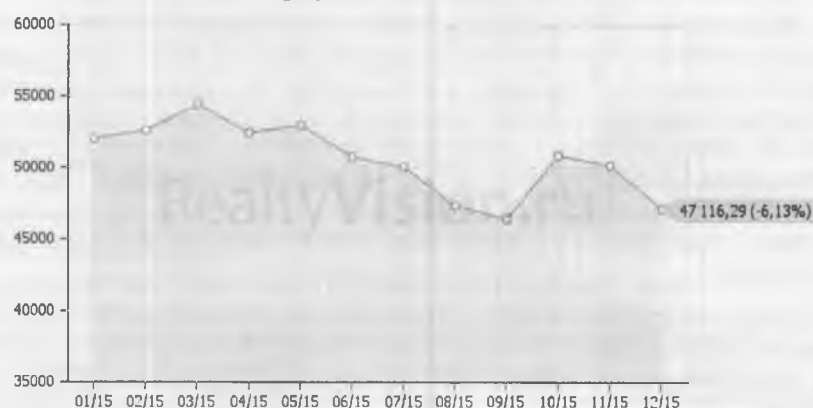
Динамика изменения средней цены квадратного метра на рынке первичного жилья в г. Иркутске за 2014-2015 г.